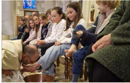
JEUDI-SAINT : Rappel de la CÈNE et LAVEMENT DES PIEDS des enfants à Saint-Laurent