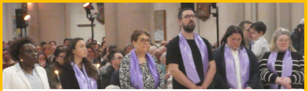
Les CATHÉCUMÈNES qui ont demandé et reçu le sacrement du BAPTÊME PAR IMMERSION