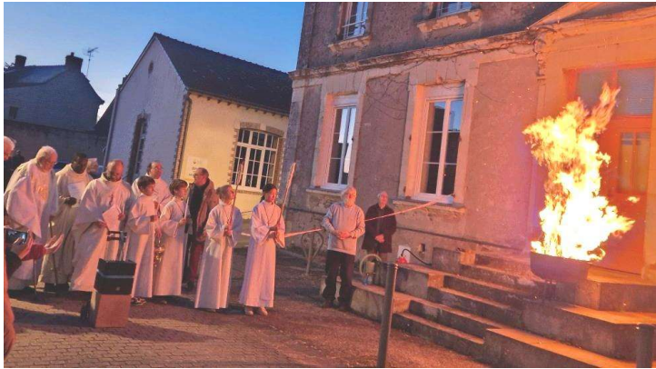
VENDREDI-SAINT SAMEDI-SAINT : FEU et LUMIÈRE de Pâques à l'extérieur