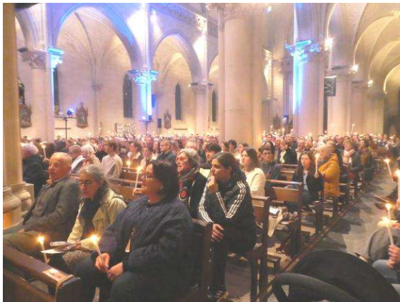
VEILLÉE PASCALE et CÉLÉBRATION INTERPAROISSIALE Saint-Florent le Vieil – Saint-Georges-sur-Loire – La Pommeraye