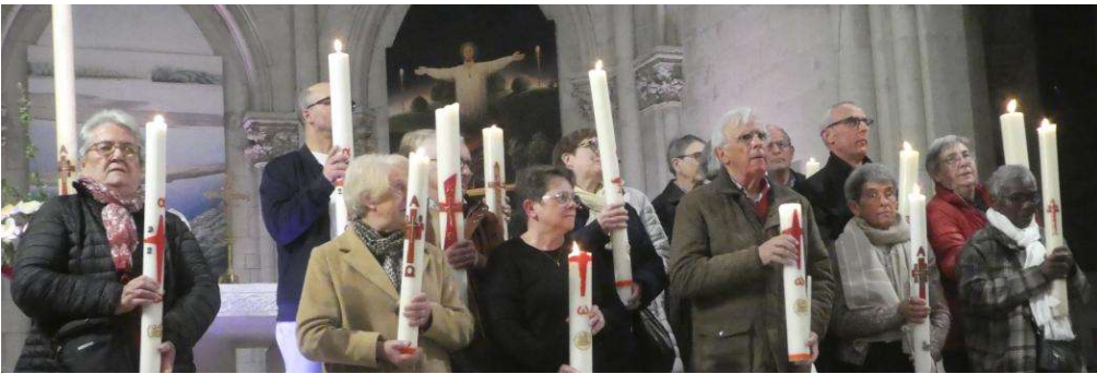
Remise d'un cierge pascal aux responsables des différents relais des 3 paroisses